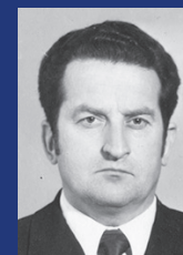
Альфонс Ильич Тишкевич