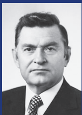
Кирилл Трофимович Мазуров