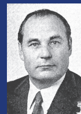
Владимир Андреевич Микулич

С 1985 г. был первым секретарем Минского обкома компартии Белоруссии, одновременно с апреля 1990 г. председатель Минского областного Совета народных депутатов. Председатель Палаты представителей Национального собрания Республики Беларусь (1996–2000). Почетный гражданин города Гомеля.