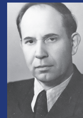
Никита Иванович Паращенко

В 1938–1940 годах – секретарь Слуцкого райкома КП(б)Б, в 1940–1941-м – 2-й секретарь Каунасского горкома КП(б) Литвы. С августа 1941-го на фронте. Секретарем Минского обкома КП(б)Б стал в 1946 году. В 1948–1952 годах – председатель Минского облисполкома.