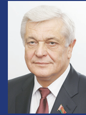
Борис Васильевич Батура

Работал заместителем председателя Гродненского облисполкома, министром жилищно-коммунального хозяйства, заместителем премьер-министра Беларуси, председателем Могилевского облисполкома. Являлся председателем Совета Республики. С 2010 по 2013 год возглавлял областной исполнительный комитет.